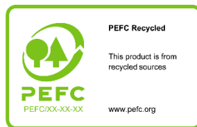
Tableau 2 : Aperçu des options d'utilisation de PEFC sur les labels de produits

7.1.2.2.1 Le label PEFC recyclé devra être utilisé lorsque le produit inclut uniquement de la matière recyclée (voir 3.15, définition de la matière recyclée ). Le nom du label est « PEFC recyclé » et le message du label : « [Ce produit] est issu de sources recyclées ». La mention [ce produit] peut être remplacée par le nom du produit certifié ou de la matière certifiée incluse dans le produit auquel le label fait référence, en utilisant le générateur de labels.